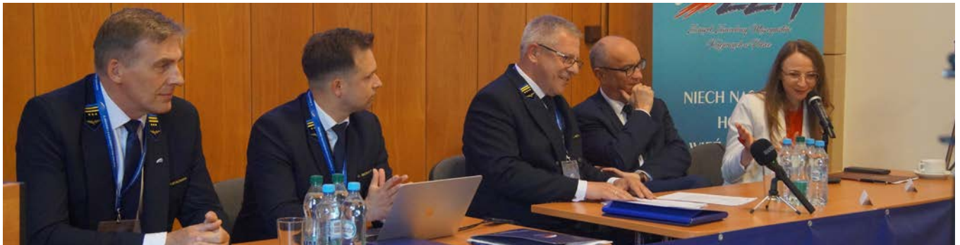
Prezydium ZKM z gośćmi KZD: marszałkiem Sejmu Włodzimierzem Czarzastym i ministrami rodziny i polityki społecznej Agnieszka Dziemianowicz-Bąk.