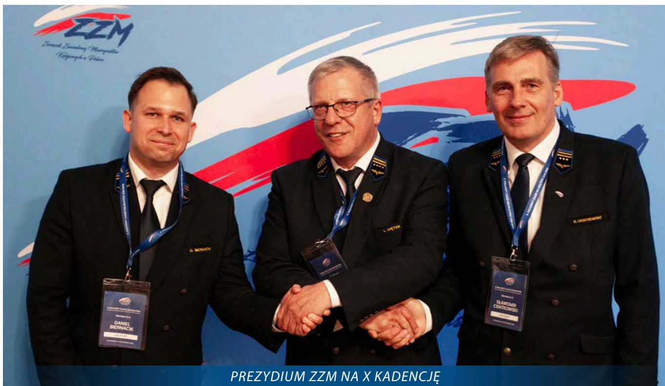
PREZYDIUM ZMZ NA X KADENCJĘ

przebiegu niektóre sprawy organizacyjne zostały podjęte wcześniej przez Radę Krajową.