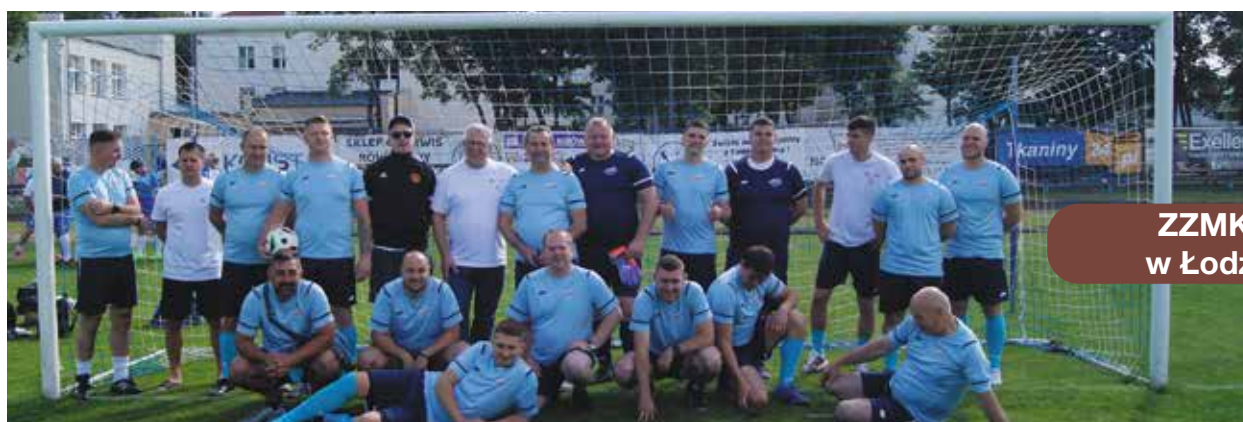
ZZMK w Łodzi