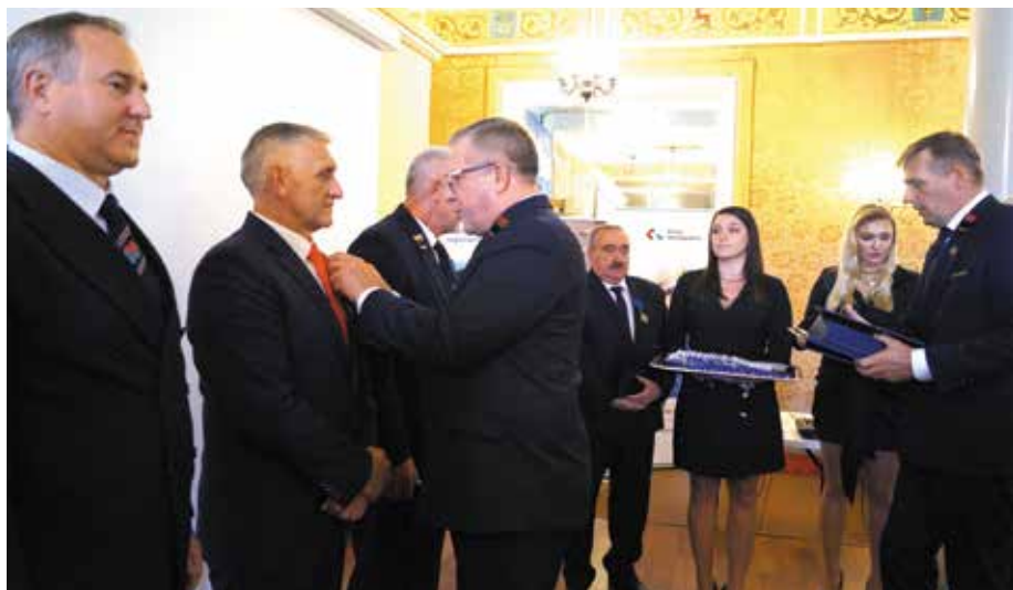
Obchody Dnia Maszynisty w Sali Lustrzanej Stacji Muzeum w 2022 roku