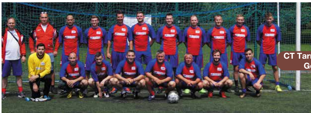
CT Tarnowskie Góry