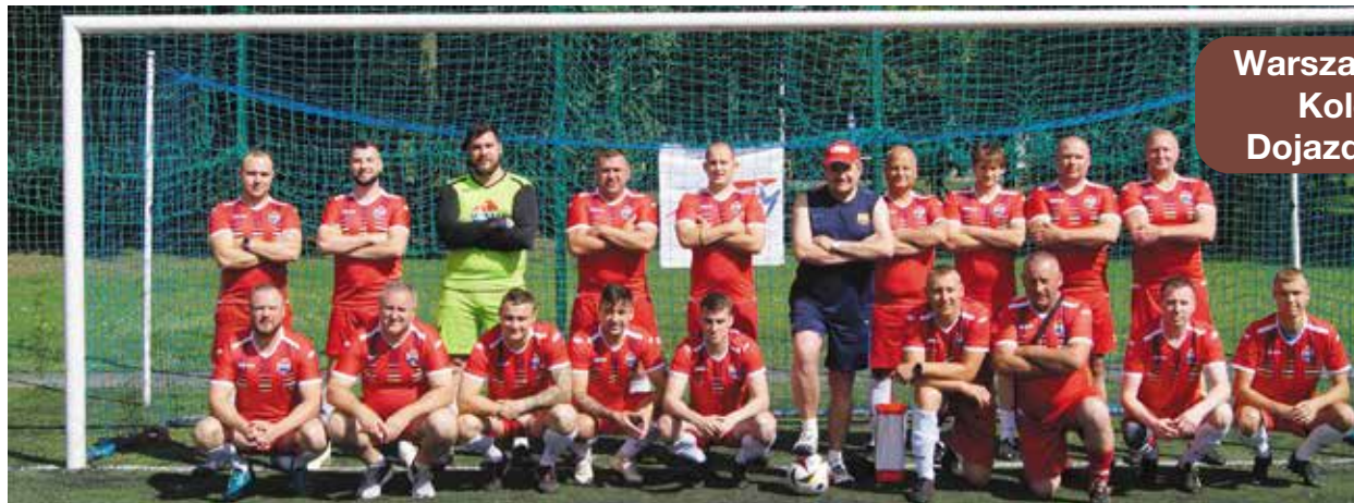
Warszawska Kolej Dojazdowa