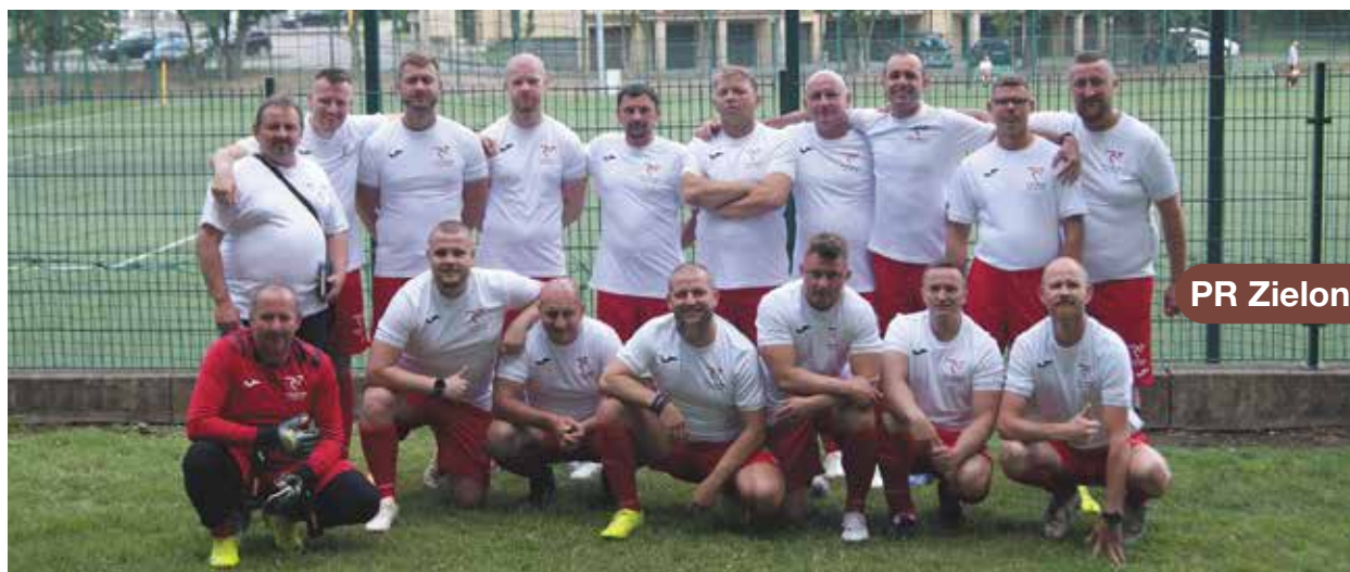
PR Zielona Góra