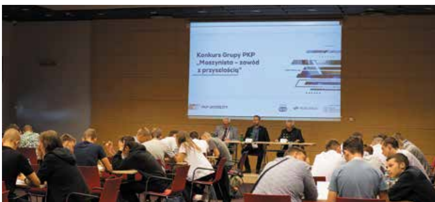
Grupa PKP propagowała wśród młodzieży zawód maszynisty

Na Dniach Edukacji i Kariery sporo uwagi poświęcono zawodowi maszynisty. Całodzienne wydarzenie z możliwością jazdy na symulatorze pojazdu trakcyjnego cieszyło się tradycyjnie bardzo dużym zainteresowaniem.