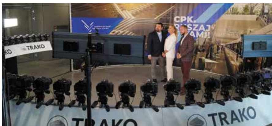
Ścianka do zdjęć propagująca ideę Centralnego Portu Komunikacyjnego