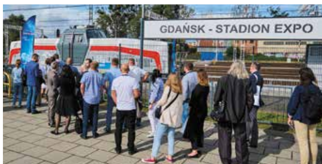
Chętnych do przejażdżki w kabinie lokomotywy wodorowej Pesy nie brakowało