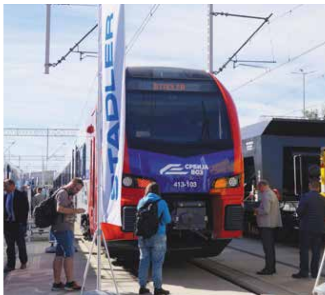
Flirt Stadlera dla Kolei Serbskich