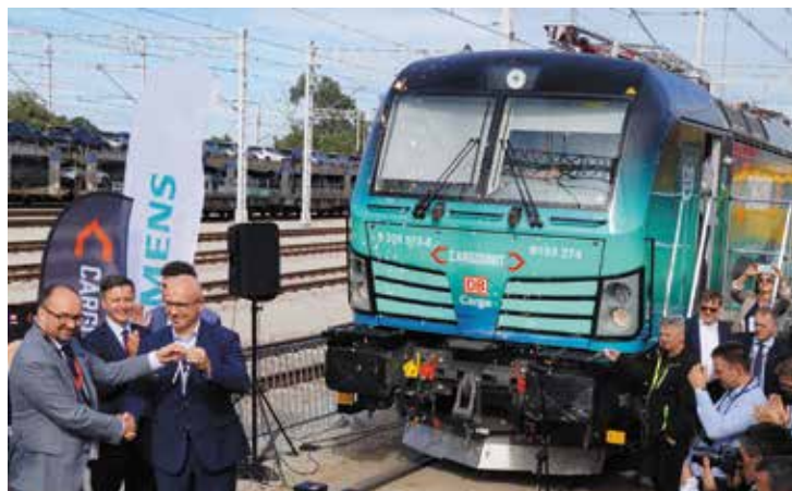
Symboliczne przekazanie kluczy do Vectrona do DB Cargo Polska