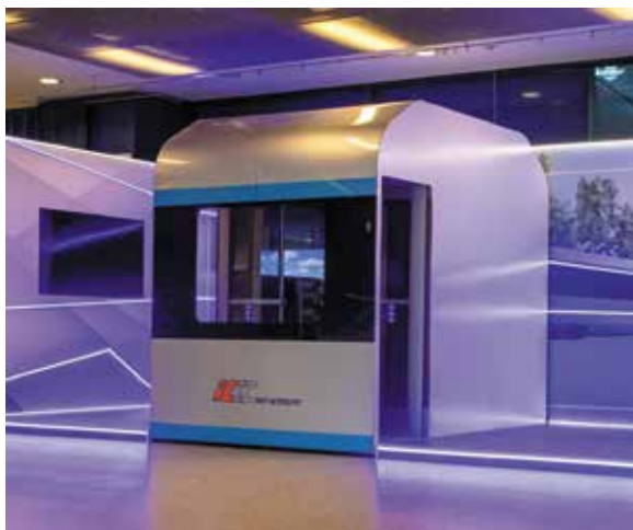
▲ ▼ Makieta nowego przedziału 1 klasy PKP Intercity