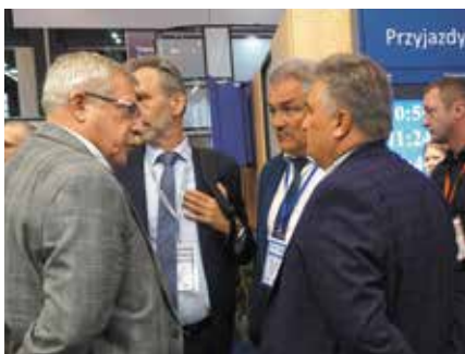
Trako to także dobra okazja do spotkania i rozmowy o podwyżkach

Z kwestii taborowych w świetle fleszy odbyło się również inne wydarzenie. Cargounit – polska firma wynajmująca lokomotywy – odebrał od Siemens Mobility kolejną wielosystemową lokomotywę Vectron MS. Z miejsca została przekazana do DB Cargo Polska.