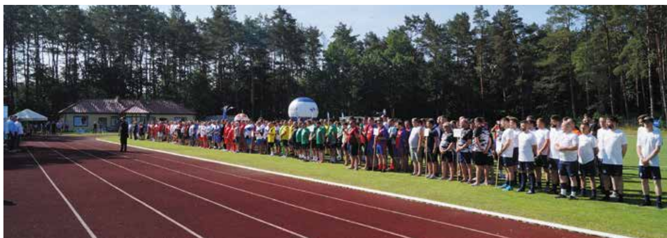
Uroczysta defilada drużyn