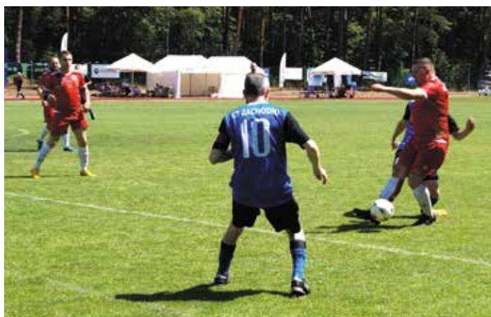
Boiska były świetnie przygotowane do gry