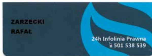
Pierwsza legitymacja Lex Secure dla członków ZZM

Związek Zawodowy Maszynistów Kolejowych w Polsce, 02-021 Warszawa; ul. Grójecka 17 tel/fax 22 274 2616 rkzzm@wp.pl www.zzm.org.pl