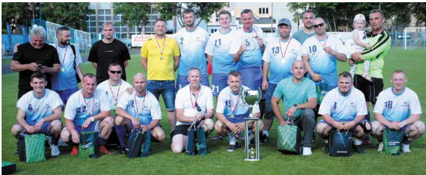
Zwycięzcy XXIII turnieju – CT Północny z Pucharem Prezesa PKP SA

passę kontynuował CT Północny, pokazując drużynie Cargo Service na czym polega gra do ostatniego gwizdka. Ostatniego półfinalistę wyłonił „derbowy” pojedynek