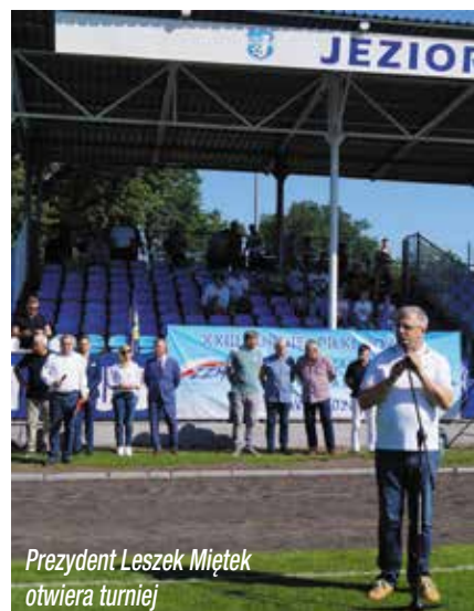
Prezydent Leszek Miętek otwiera turniej