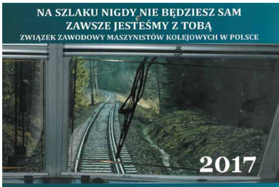
Do solidarności zawodowej i koleżeństwa odwoływaliśmy się m.in. w kalendarzu trójdzielnym ZZM na 2017 rok

Sama ekspertyza okazała się być sporządzona przez człowieka bez doświadczenia. Podczas serii pytań zadawanych przez adwokata wyszło na jaw, że jego wiedza kolejowa nie jest wystarczająca by być miarodajną. W trakcie procesu zresztą zmieniał stanowisko i swoją opinię.