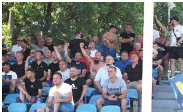
Na meczu Dyrektorzy–Maszyniści mieliśmy kibicowski, kulturalny pojedynek na doping na trybunach