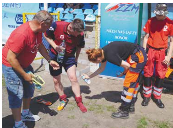
Służby medyczne miały trochę pracy