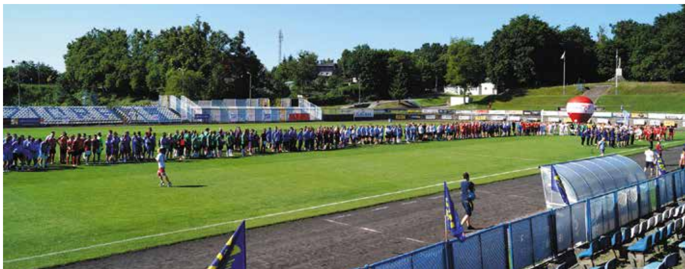
Efektowna defilada drużyn na płycie głównej IKS Jeziorak