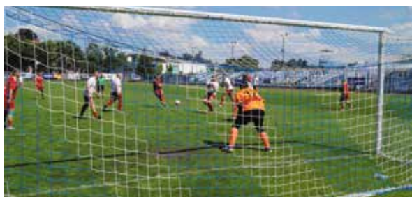
Pogoda dopisała aż za bardzo, ale dało się grać

sieli uznać faworyzowani goście z Czech. Obie te drużyny były raczej poza zasięgiem uzupełniających stawkę Kolei Śląskich i Cargo Taboru, którym zasadniczo pozostała walka między sobą o trzecie miejsce.