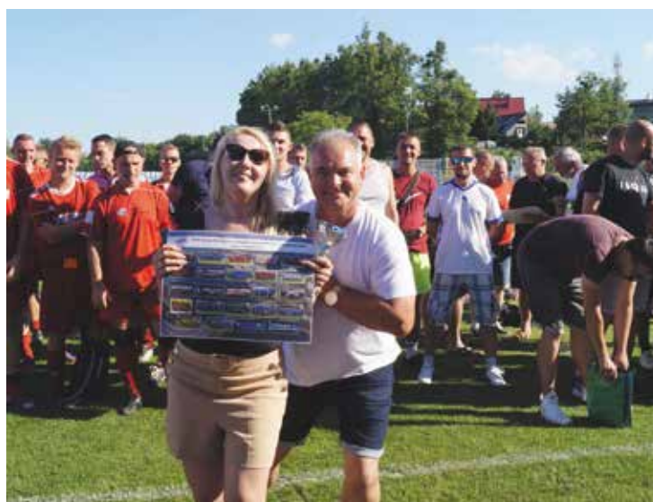
Organizatorzy zadbali by zwycięzcami mogła poczuć się każda drużyna