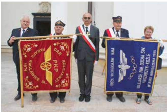
W uroczystości udział wzięli czynni i emerytowani członkowie ZSM