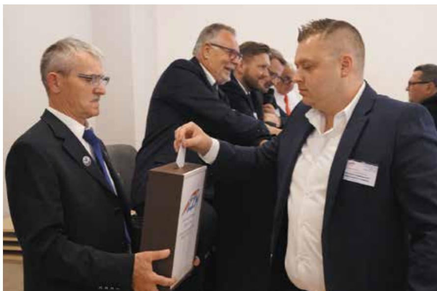
Nad sprawnym przebiegiem głosowań czuwała Komisja Skrutacyjna