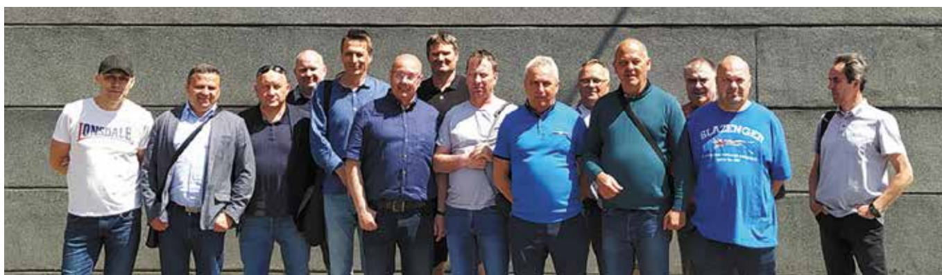
Nasz kolega z grupą wspierającą, która towarzyszyła mu podczas ogłoszenia wyroku