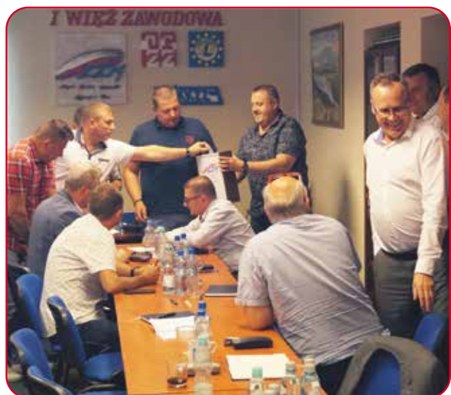
Wybory kierownictwa Sektora Przewozów Towarowych