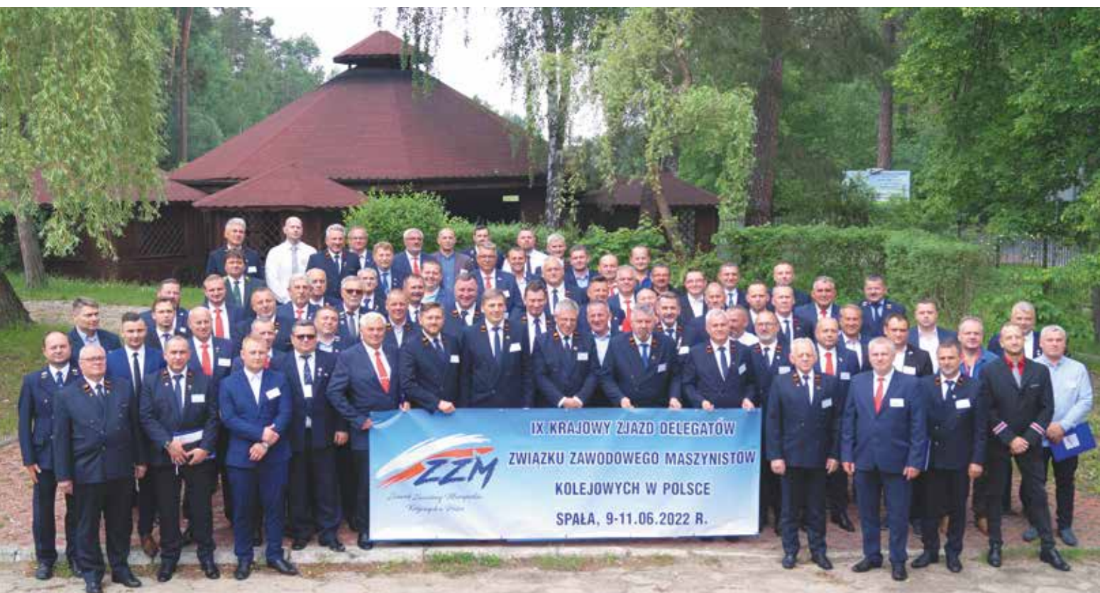
Pamiątkowe zdjęcie uczestników IX Krajowego Zjazdu Delegatów w Spale