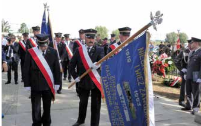
Poczet sztandarowy ZZM Zajączkowo Tczewskie podczas uroczystości patriotycznych

Niespodziewanie w grudniu ub.r. stało się ono miejscem... konferencji prasowej. Prezes pomorskiego oddziału Młdzieży Wszechpolskiej Rafał Buca poinformował na niej o zamiarze zbierania podpisów pod projektem uchwały domagającej się zmiany nazwy Ronda Dworcowego na Rondo im. Romana Dmowskiego. Wśród pohukiwań typu cyt.: „Nie chcecie Dmowskiego w Warszawie to będzie w Tczewie” zaklejona została tabliczka