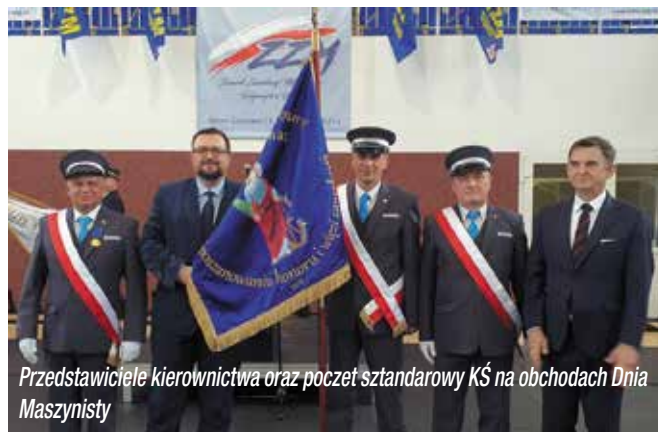
Przedstawiciele kierownictwa oraz poczet sztandarowy KŚ na obchodach Dnia Maszynisty

Dokument zawiera także zapisy o rozpoczęciu prac nad zmianą treści układu zbiorowego spółki w zakresie gratyfikacji dla pracowników z okazji Święta Kolejarza i otrzymania odzna-