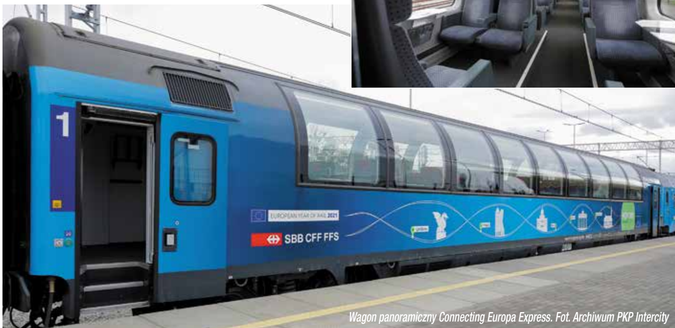
Wagon panoramiczny Connecting Europa Express.