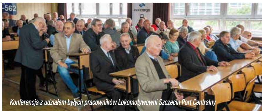
Konferencja z udziałem byłych pracowników Lokomotywni Szczecin Port Centralny