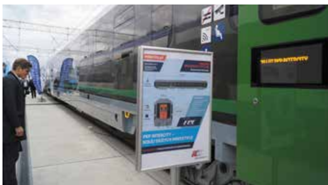
PKP Intercity pokazała Griffina z Newagu w jubileuszowych barwach oraz wagon do przewozu wojska z FPS H. Cegielski

Szczególną uwagę wzbudziła ekspozycja taboru, która po raz pierwszy odbyła się w nowej, w sensie zmodernizowanej i dostosowanej pod tym kątem, przestrzeni torów wystawienniczych stacji Gdańsk Zaspas Towarowa oraz Gdańsk Stadion Expo. Na jeden dzień zawitał tam uruchomiony z okazji Europejskiego Roku Kolei pociąg specjalny „Connecting Europe Express”. Bodaj największą uwagę przykuła premiera prototypu pierwszej polskiej lokomotywy wodorowej. Jak informuje producent, czyli bydgoska Pesa,