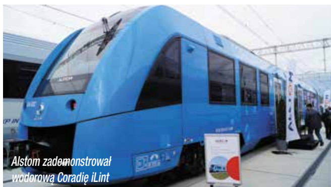
Alstom zademonstrował wodorową Coradię iLint