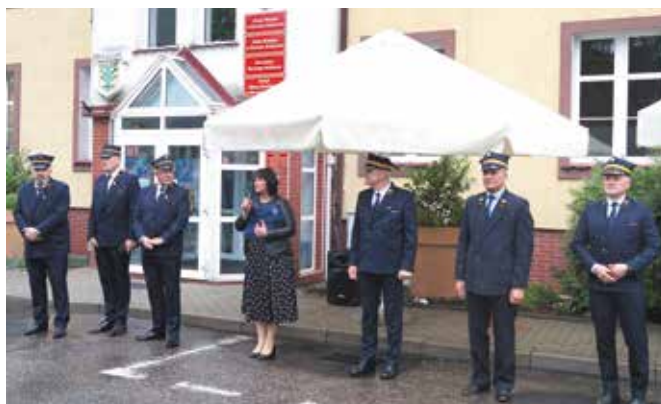
Burmistrz Bornego Sulinowa przywitała uczestników

naszej grupy zawodowej. Następnie grupę maszynistów uhonorowano odznaczeniami. W imieniu prezydenta RP „Złote Medale za Długoletnią Służbę”, a także odznaczenia resortowe „Zasłużony dla Transportu RP” i „Zasłużony dla