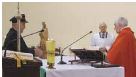
Wręczenie figurki patronki kolejarzy podczas mszy św. w intencji maszynistów