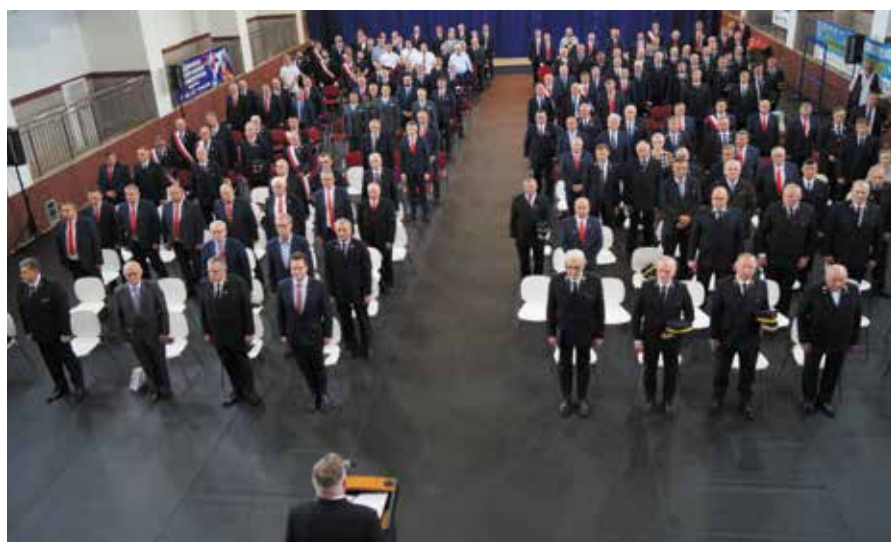
Akademia rozpoczęła się od minuty ciszy, poświęconej Kolegom którzy udali się na ostatnią służbę

Kwestie bezpieczeństwa sprawiły w tym roku, że pewnym modyfikacjom musiała ulec część rozrywkowa Dnia Maszynisty. Względem zdrowotne zdecydowały o rezygnacji z organizacji tradycyjnego balu z udziałem „lepszych połów”. Zamiast niego odbyła się karczmą o charakterze regionalnym, na świeżym powietrzu. ■