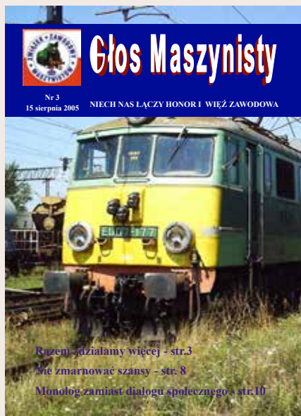
Pierwszy numer w nowej formule ukazał się w sierpniu 2005 roku. Zawierał 16 stron, 4 w pełnym kolorze.

Jubileuszowy, dwusetny numer „Głosu Maszynisty”, jest dobrą okazją do zobrazowania pokrótce jak rozwinęliśmy skrzydła i czym się zajmowaliśmy.