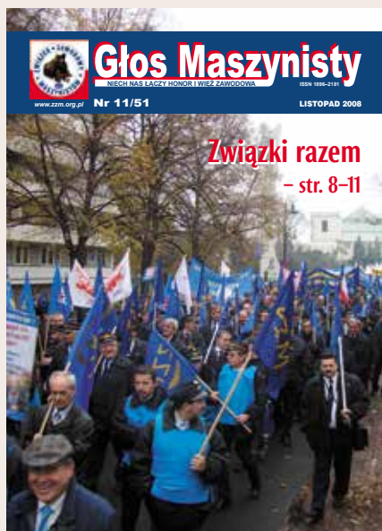
Pod koniec 2008 r. dzięki determinacji udało się obronić prawo do emerytur pomostowych dla kolejarskich profesji.