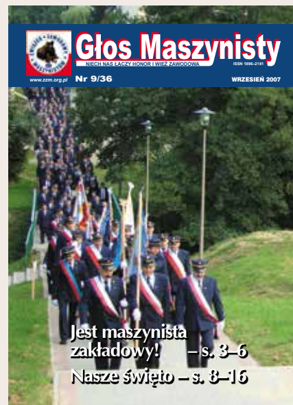
Od połowy 2007 r. objętość pisma rozszerza się do 20 stron, choć przy dobrej okazji zdarzały się i 24.