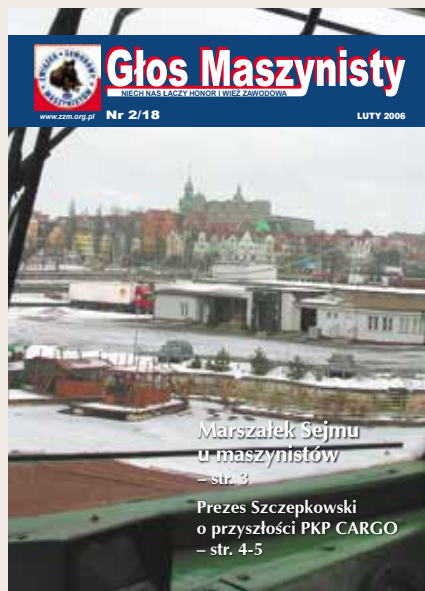
W pełnym kolorze GM ukazuje się od 2006 roku. Od lutego stosujemy podwójną numerację (2/18).