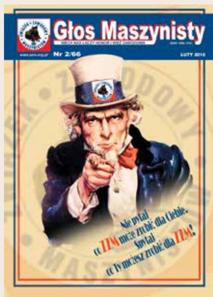
Do mobilizacji i walki o swoje GM 10/2010 nawoływał wykorzystując m.in. plakat rekrutacyjny U.S. Army z Wujkiem Samem.