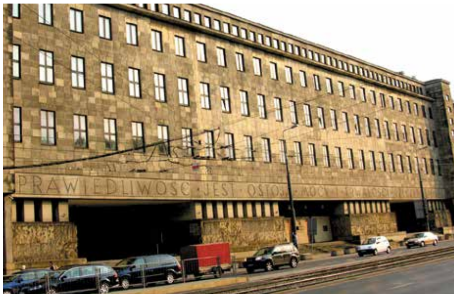
Cytat Andrzeja Frycza Modrzewskiego „Sprawiedliwość jest ostoją mocy i trwałości Rzeczypospolitej” zdobi budynek warszawskiego sądu