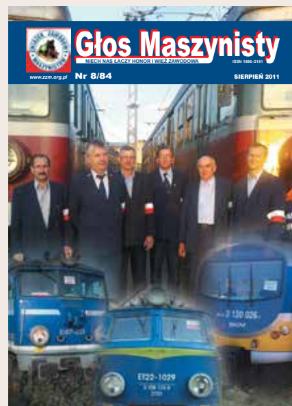
Okładkę w sierpniu 2011 r. poświęcamy pierwszemu od 13 lat strajkowi generalnemu na kolei – w Przewozach Regionalnych, gdzie udało się wywalczyć podwyżki.