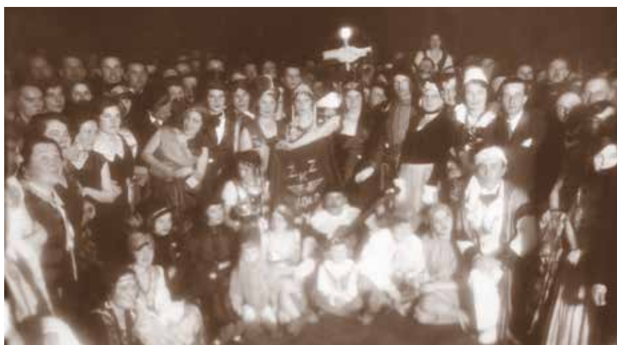
Bal maskowy kolejarzy w Nowym Sączu w 1933 r.