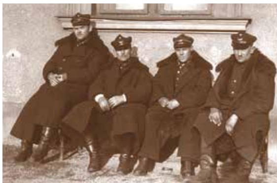
Lata. 30. Odświętnie udekorowany parowóz z okazji 150-lecia odsieczy wiedeńskiej i ówczesni kolejarze