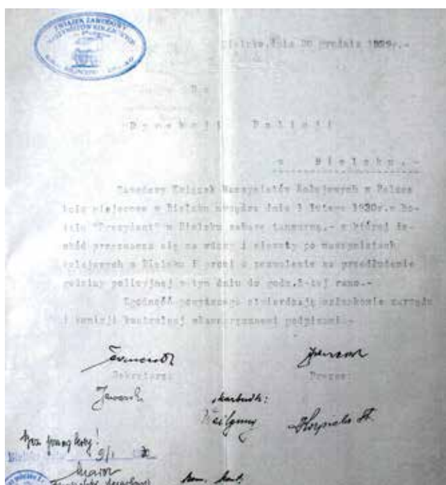
Pisma przedwojennego Koła ZZM do Urzędu Skarbowego i Dyrekcji Policji ws. organizacji „redutry maskowej” i zabawy tanecznej z 1927 i 1930 r.