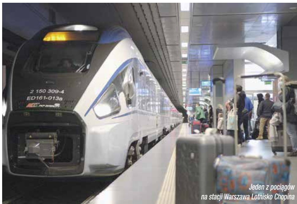
Jeden z pociągów na stacji Warszawa Lotnisko Chopina