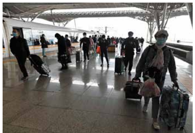
Pociąg Kolei Chińskich na stacji Wuhan