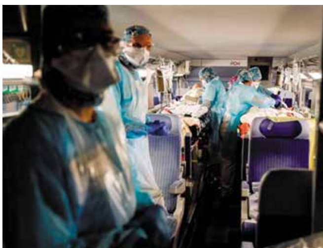
Pociąg ratunkowy TGV