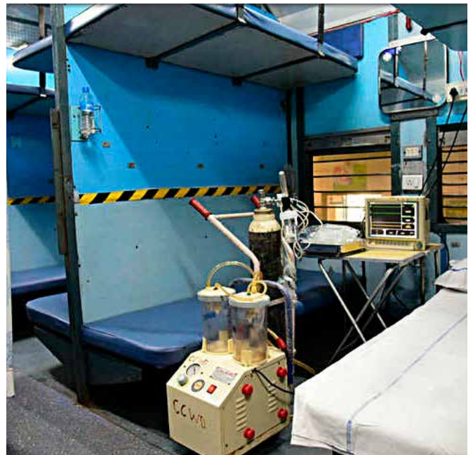
Wagony-izolatki Kolei Indyjskich