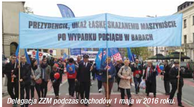
Delegacja ZZM podczas obchodów 1 maja w 2016 roku.

Pandemia koronawirusa spowodowała konieczność odwołania obchodów Międzynarodowego Świąta Pracy 1 maja w Warszawie oraz czerwcowego turnieju piłki nożnej o Puchar Prezydenta ZZM i Prezesa PKP SA.