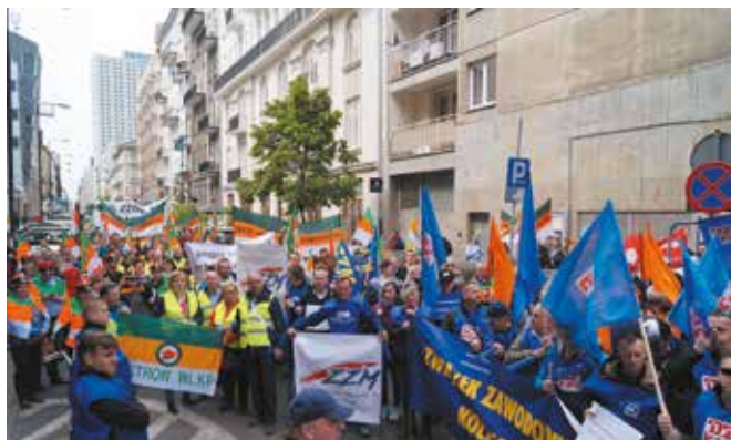
Silna grupa dyżurnych ruchu