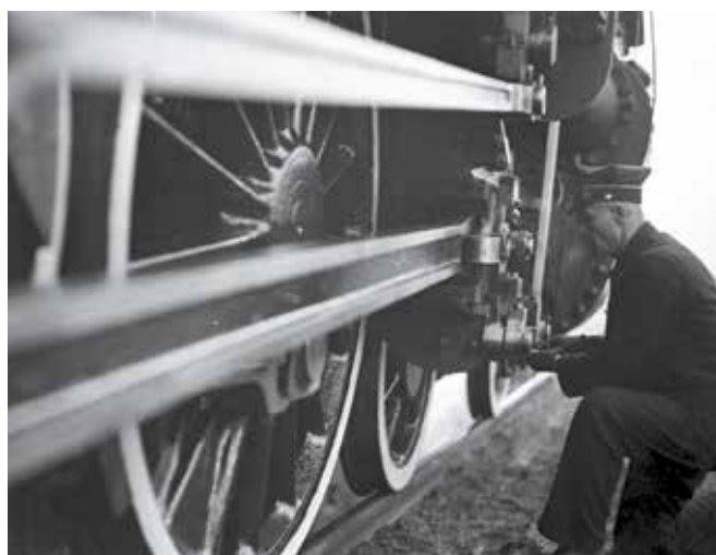
Maszynista przy parowozie Os24

Józef Piłsudski docenił wsparcie uzyskane od kolejarzy z tamtego okresu i przyczynił się do rozwoju kolei w Polsce. Na wyraźne żądanie marszałka 24 września 1926 r. wydane zostało rozporządzenie prezydenta Ignacego Mościckiego powołujące przedsiębiorstwo Polskie Koleje Państwowe. Uregulowało status