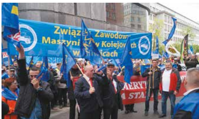
Górnicy i maszyniści – oba zawody są wykonywane w szczególnych warunkach, które jednak się nie zmieniają od 1999 r.