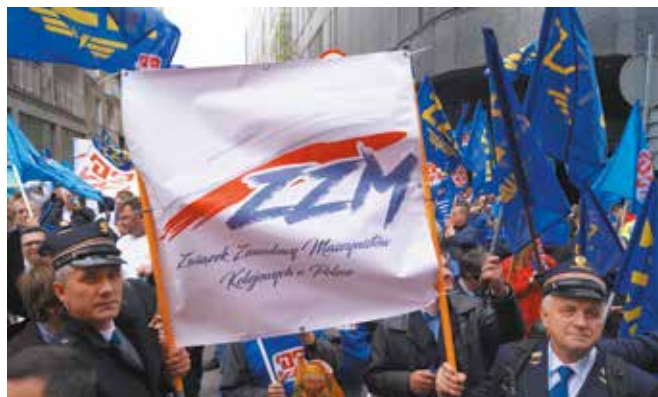
Związkowcy ZKM zawsze stają w obronie praw pracowniczych