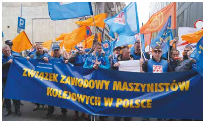
Liczenie stawili się na pikiecie członkowie ZZM, którym nieobojętne jest wygaszanie emerytur pomostowych