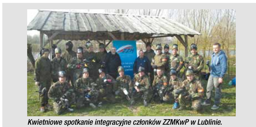
Kwietniowe spotkanie integracyjne członków ZZMKwP w Lublinie.