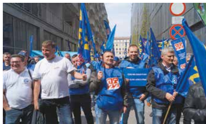
Emerytury stażowe – 35 dla kobiet i 40 dla mężczyzn czynnej pracy zawodowej