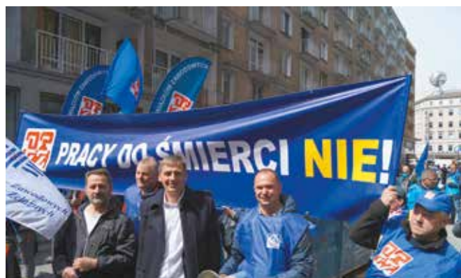
Głośno mówimy NIE