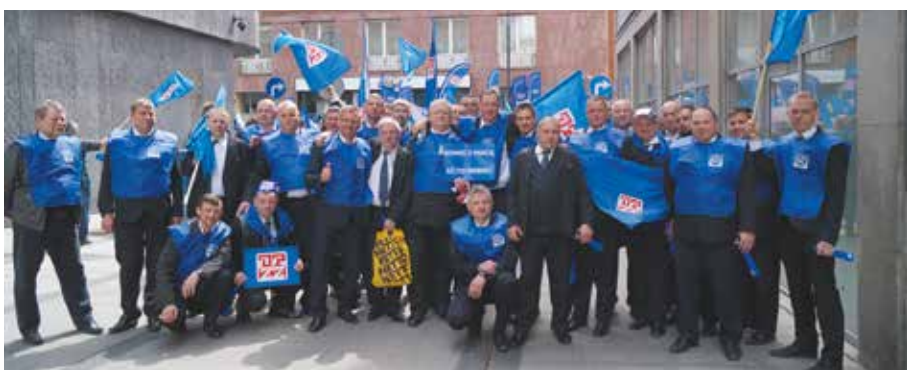
SKM w Trójmieście jak zawsze silna drużynowo