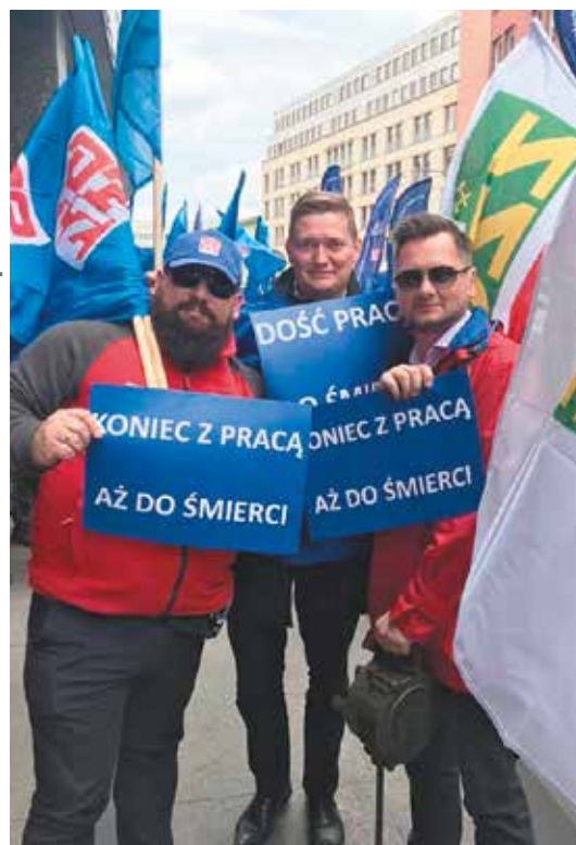
Przedstawiciele Rad OPZZ z jednym z haseł przewodnich pikiety

Już od rannych godzin, pod siedzibą Ministerstwa Rodziny, Pracy i Polityki Społecznej zaczęli zbierać się związkowcy z całego kraju aby przypomnieć o zapomnianych – zdaniem protestujących – obietnicach.