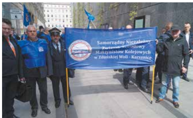
Przyjechali maszyniści z całej Polski