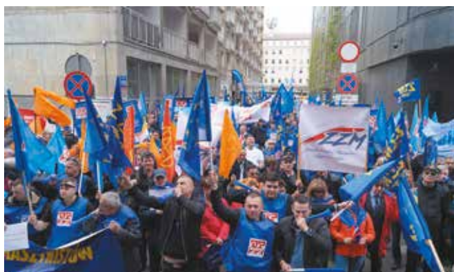
Niezależnie od wieku czy stażu temat praw emerytalnych nikomu nie jest obojętny