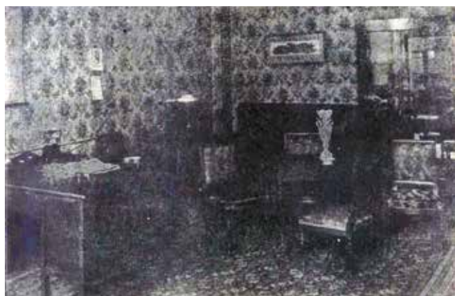
Gabinet prezesa ZZM na ul. Chmielnej

prawno-organizacyjny kolejnictwa i stworzyło podwaliny do ujednoczenia kwestii pracowniczych czy emerytalnych.