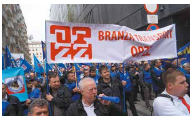
Branża Transport OPZZ w mocnej reprezentacji