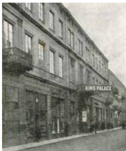
Siedziba ZZM na Chmielnej 9 od strony ulicy

Bardzo świeża musiała być także pamięć o poprzednim (nazywanym przez historyków drugim) endecko-chłopskim gabinecie Wincentego Witosa, do którego przyłgnęło miano krwawego. O strajku maszynistów ZZM i zbrojnej konfrontacji robotników z siłami wojska i policji na ulicach Krakowa jesienią 1923 r. Świadcetwo tego znajdujemy w „Maszyniście”: cyt. „nie pierwszy to raz społeczeństwo nasze w oparach krwi bratniej, wśród świstu kul i jęków umierających, likwiduje rządy p. Witosza. Żywo nam stoją przed oczyma wypadki listopadowe z roku 1923, w których my, maszyniści, nie małą odegraliśmy rolę. Ci sami nieomal ludzie, analogiczna sytuacja” – tak interpretowano trzydniowe boje na ulicach Warszawy. Pochłonęły one 379 ofiar śmiertelnych, w tym 164 cywilów.