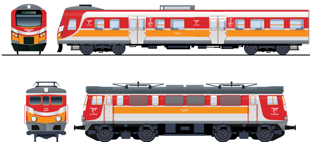
Wizualizacja EN57 AL i EP07 PR w malaturze marki handlowej Polregio