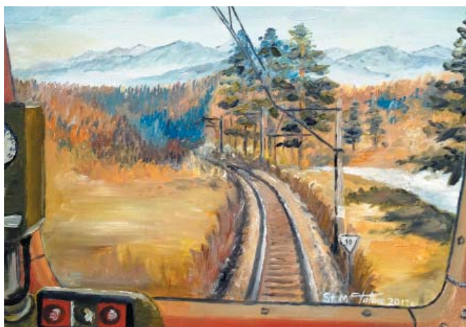
Widok z kabiny maszynisty. Okolice Piwnicznej...