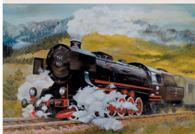
Parowóz Ty 2 na szlaku