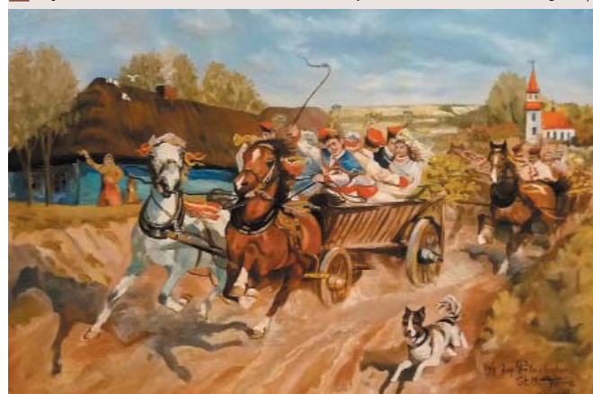
Replika „Wesela krakowskiego” ▼