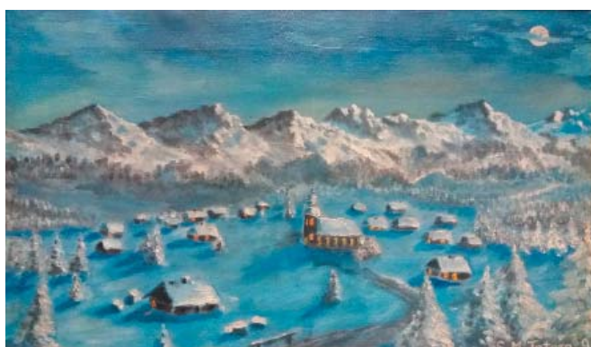
Jeden z pierwszych pejzaży (1991 r.)