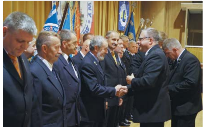
Centralne obchody EDM. Moment wręczania odznak Zasłużony dla ZZM