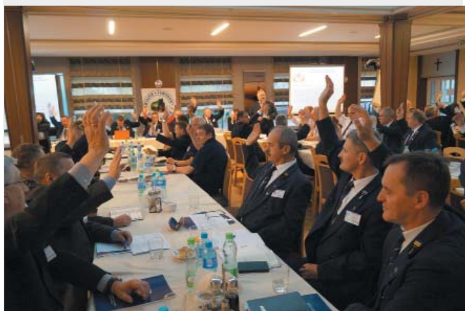
Krajowy Zjazd Delegatów ZZM