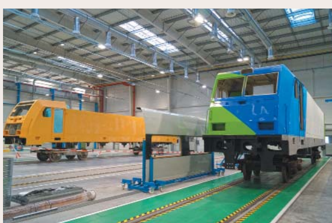
Lakierowanie nadwozi lokomotyw

związków zawodowych. Fabrykę odwiedził także wicepremier, minister finansów i rozwoju Mateusz Morawiecki. – Cieszę się, że światowy lider w branży kolejowej i lotniczej rozszerza swoją działalność w Polsce. Rozbudowa fabryki Bombardiera we Wrocławiu, po LG Chem, Daimlerze i Toyocie, to kolejna duża inwestycja realizowana w ostatnim miesiącu na Dolnym Śląsku. Pokazuje, że Polska cieszy się zaufaniem inwestorów, a polski rząd jest dla nich wiarygodnym partnerem. To także jasny sygnał, że nasz kraj jest otwarty na innowacje w obszarze przemysłu. Ta inwestycja wpisuje się w nasz Plan na rzecz Odpowiedzialnego Rozwoju w obszarze reindustrializacji. Chcemy, aby przemysł był bardziej