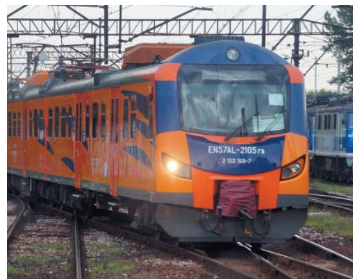
Fot. G. Mocz

Rozmowy na temat systemowego wzrostu wynagrodzeń w spółce odbędą się po analizie wyników Przewozów Regionalnych za I półrocze 2017 r., czyli w połowie sierpnia przyszłego roku.