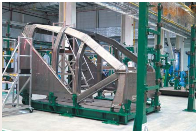
Kabina maszynisty pociągu ICE4