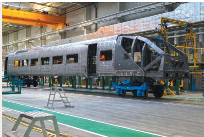
Nadwozie członu sterowniczego ICE 4 w trakcie produkcji...