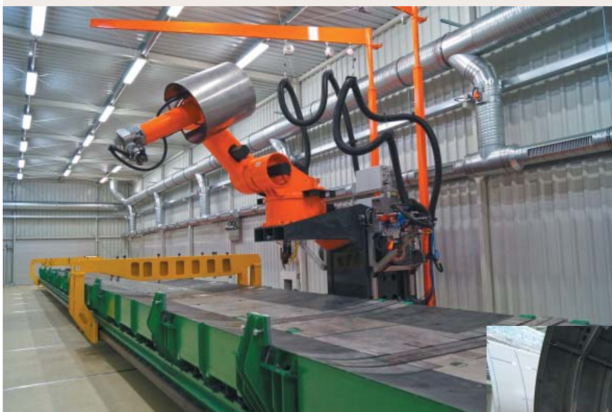
Kabina spawania laserowego 3D (stół magnetyczny i robot spawalniczy)

usytuowanych w stolicy Dolnego Śląska, Katowicach, Łodzi oraz Warszawie Bombardier Transportation Polska zatrudnia ponad 1500 osób, co czyni go największym międzynarodowym inwestorem w branży transportu szynowego w naszym kraju.