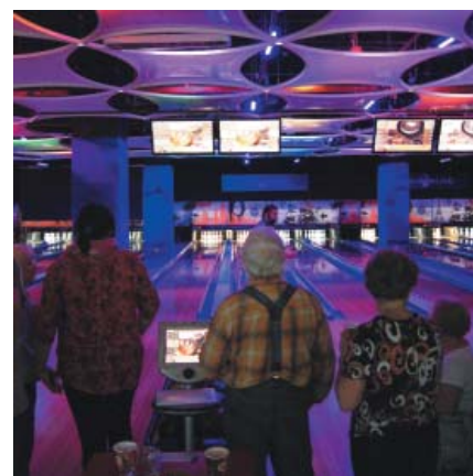
Seniorzy podczas rozgrywek w Warszawie