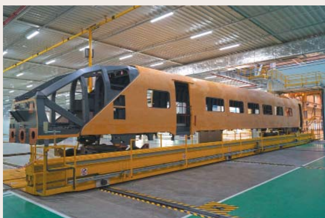
... i lakierowania