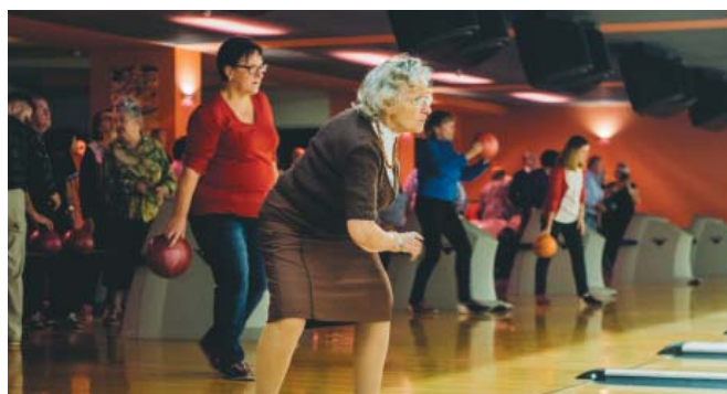
Uczestnicy turnieju podczas zawodów we Wrocławiu