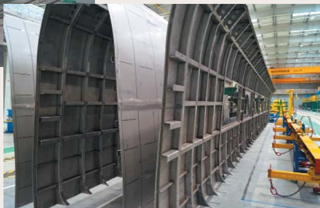
Ściany boczne nadwozi pociągów ICE 4