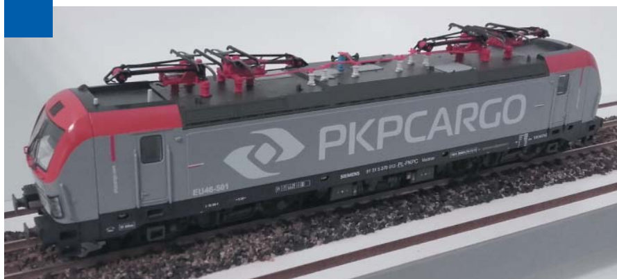
Model najnowszego nabytku PKP Cargo – lokomotywy EU46, wykonany na zamówienie przewoźnika przez firmę Robo. Seryjną produkcję podjęło natomiast niemieckie Piko.