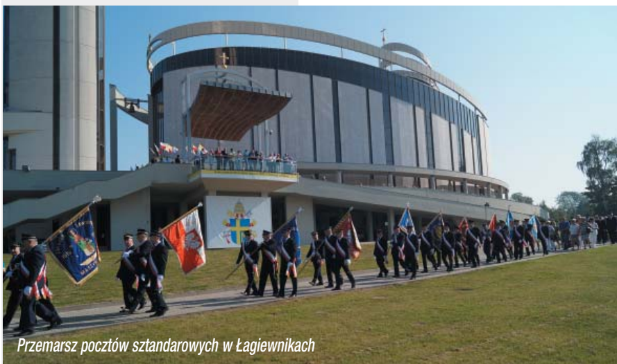
Przemarsz pocztów sztandarowych w Łagiewnikach

Program uroczystości składał się z proporcjonalnych, starannie wyważonych