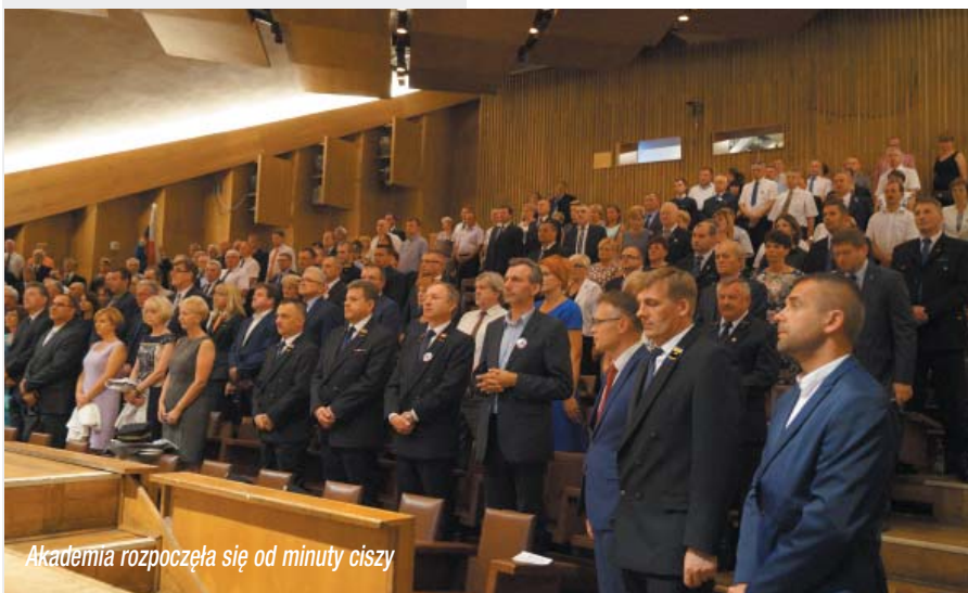
Akademia rozpoczęła się od minuty ciszy