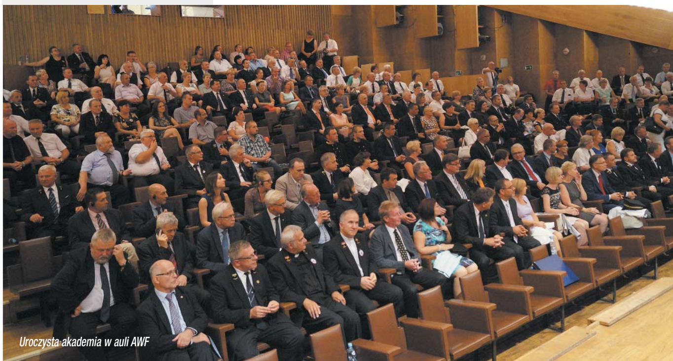
Uroczysta akademii w auli AWF