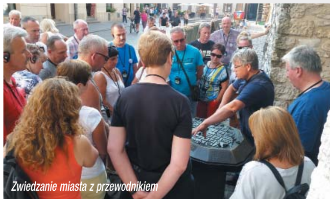
Zwiedzanie miasta z przewodnikiem