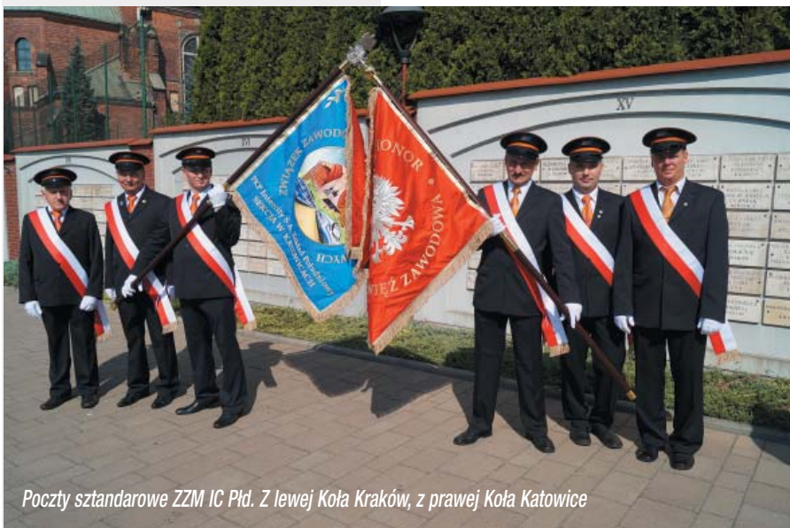
Pocztę sztandarową ZZM IC Płd. Z lewej Koła Kraków, z prawej Koła Katowice