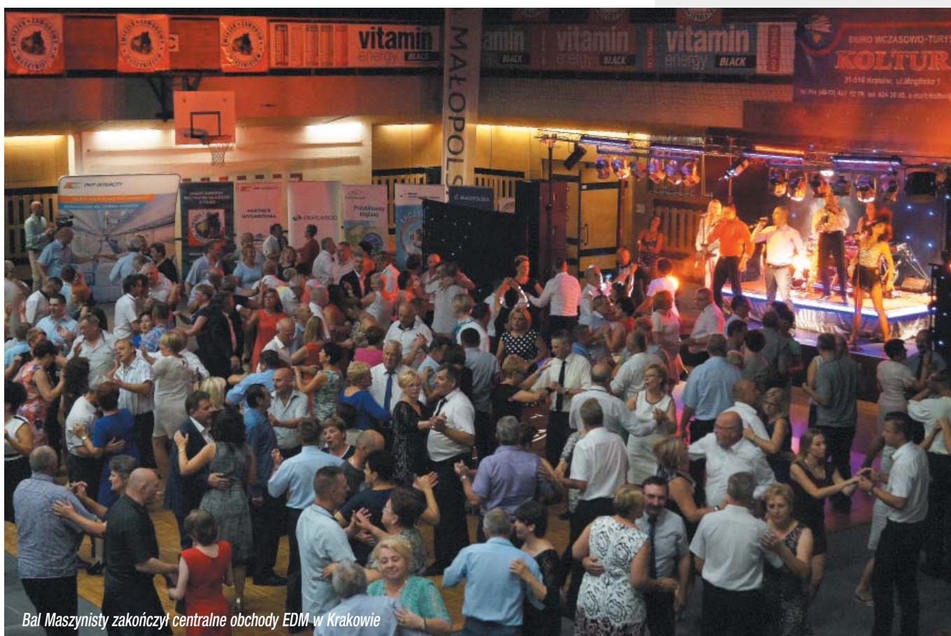
Bal Maszynisty zakończył centralne obchody EDM w Krakowie