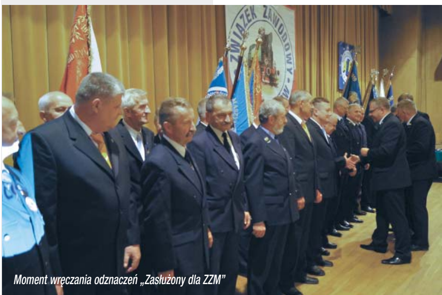
Moment wręczania odznaczeń „Zasłużony dla ZZM”