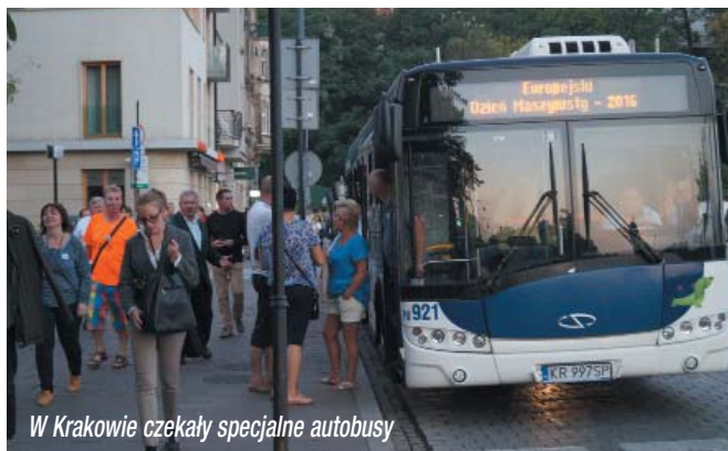
W Krakowie czekały specjalne autobusy