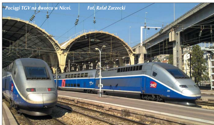
Pociągi TGV na dworcu w Nicei.

W kolejach austriackich ÖBB jest jeden silny związek kolejarzy. Ma on swoich przedstawicieli w radach nadzorczych holdingu oraz spółek wchodzących w jego skład. W holdingu w dwunastoosobowej radzie jest 4 przedstawiciele związków. Czterech przedstawiciele załogi reprezentuje interesy załogi także w siedmioosobowej (sic!) radzie ÖBB Peronenverkehr AG. Nie przeszkadza to w niczym, by koleje austriackie funkcjonowały bez zarzutu, a pracownicy korzystali z licznych, dobrze działających ośrodków kolejowych, których w Polsce pozostała już tylko garstka.