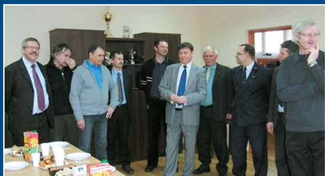
Otwarcie biura związku w Gdyni, 12.03.