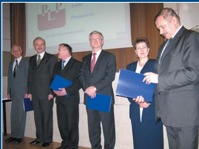
Uroczystości jubileuszowe 17 rocznicy Polskiego Lobby Przemysłowego.